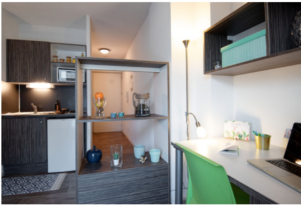
2 allée du Bon Lait 69007 Lyon